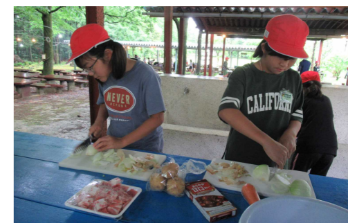
【宿泊学習でのカレーづくり】