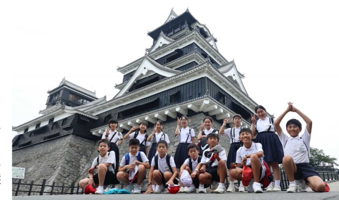
【熊本城にて記念撮影】

熊本城や田原坂、熊本市動植物園に行きました。グリーンランドでは、絶叫マシンをはじめ、たくさんのアトラクションを満喫することができました。学校に帰ってくる時はやや疲れ顔でしたが、この2日間で友情を深め、多くのことを学んで帰ってきました。最高の思い出になりましたね。