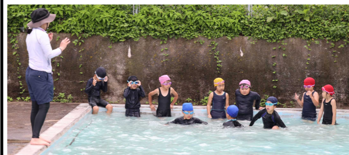
【小プールの中を移動する1年生】

1年生は初めての水遊びを行いました。校舎からやや離れているプールに、しっかり並んで移動し、水遊びに対する大事なルールを担当の先生から教えてもらいました。シャワーの水はとっても冷たかったらしく、大声で「キャーキャー」叫んでいましたが、実際にプールに入ると大はしゃぎで、とっても嬉しかったようです。